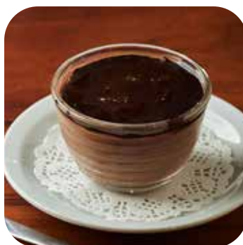
Mousse de Cacao Lps. 95.00