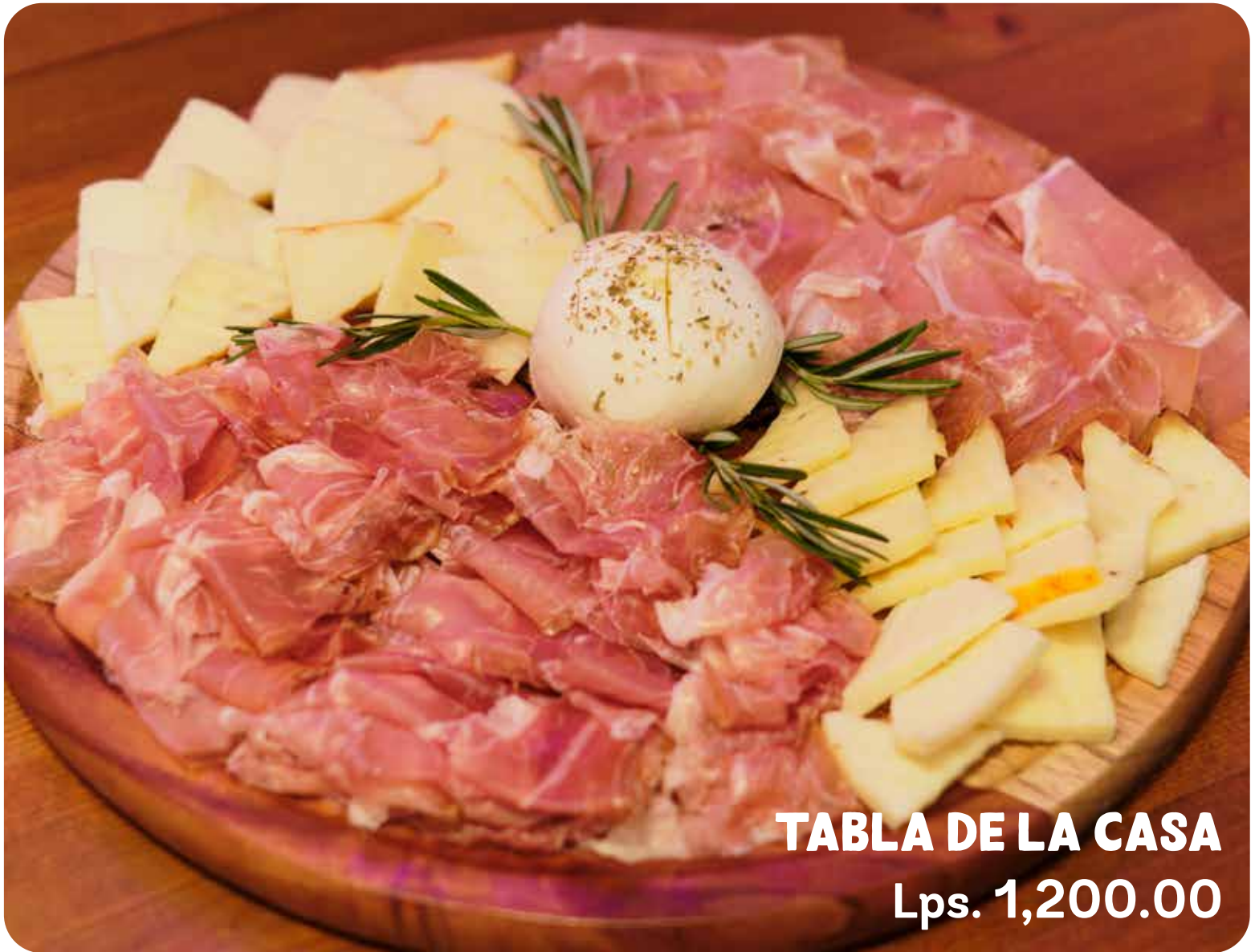
TABLA DE LA CASA Lps. 1,200.00