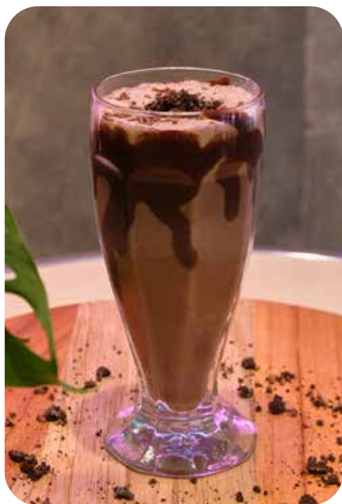
OREO SMOOTHIE Oreo, leche, sirope de chocolate, springles Lps. 165.00