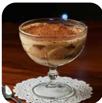
Tiramisú Lps. 185.00