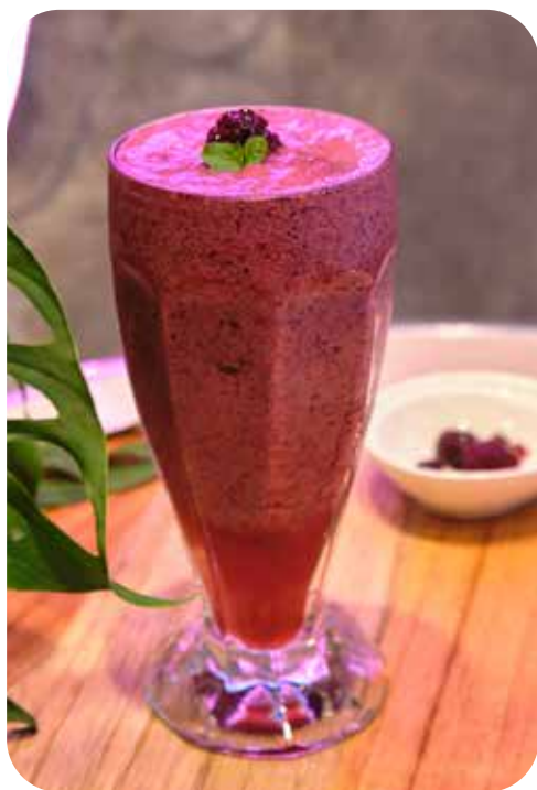
I ROSSI Frutos rojos, yogurt, miel sugar free Lps. 165.00