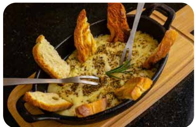
MIXTO DE QUESOS Lps. 205.00