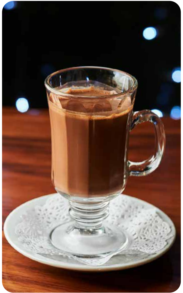
Chocolate denso italiano caliente Lps. 75.00