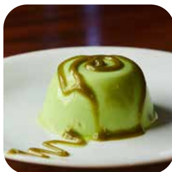
Mousse de Pistacchio Lps. 95.00