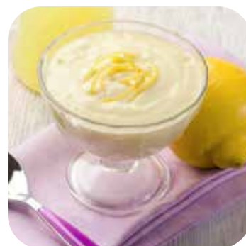
Mousse de Limón Lps. 95.00