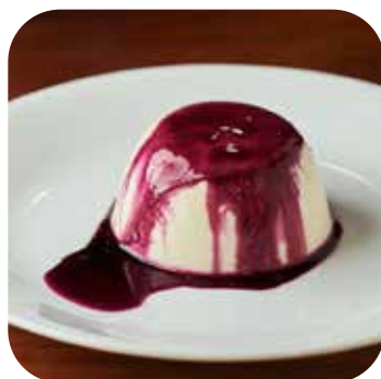
Panna Cotta Lps. 95.00