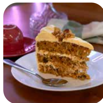
Torta de Zanahoria Lps. 185.00