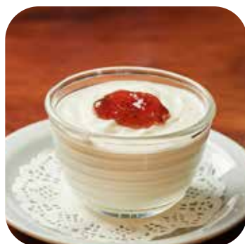
Crema de Torroncino Lps. 95.00