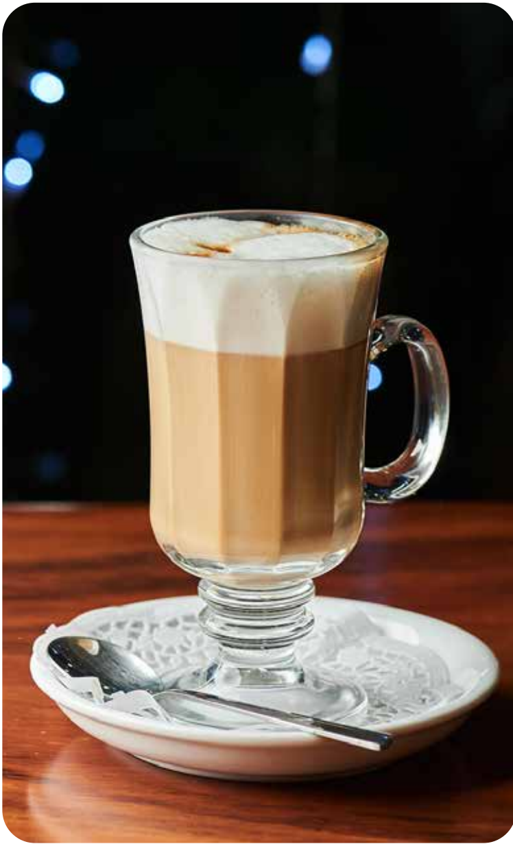
Cappuccino leche entera Lps. 60.00