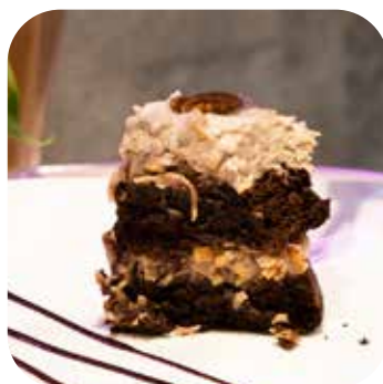
Fit German Chocolate (sin azúcares ni haria refinada) Lps. 185.00