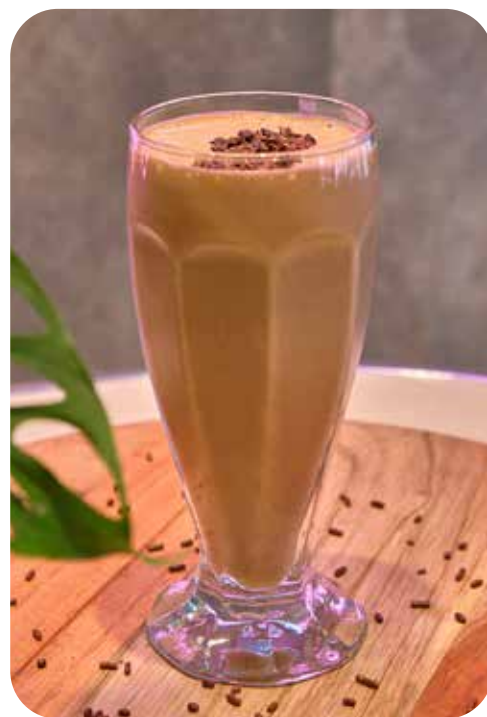
CHE DELIZIA Banana, leche de almendra, proteína gluten free, shot de café, nibs de cacao Lps. 170.00